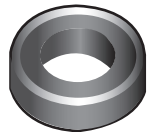
Cinta de teflón